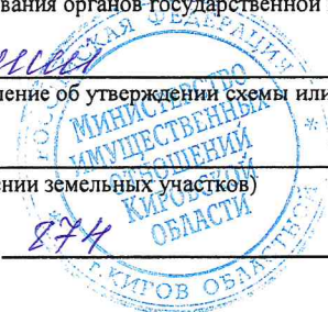
Схема расположения границы публичного сервитута на кадастровом плане территории